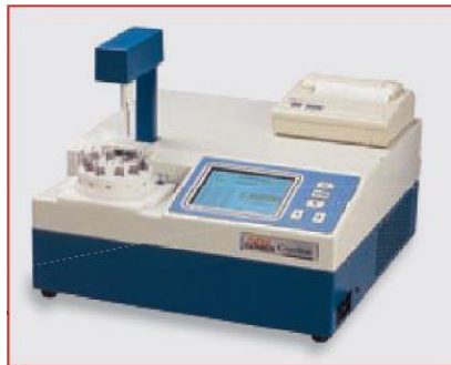
1. ábra: A CryoStar I. Automatic műszer

A fagyáspont meghatározásának fizikai háttere, hogy a túlhűtött oldatokban kiváltott gyors kristályosodás után az oldat hőmérséklete a fagyáspontjára emelkedik és ott rövid ideig állandósul. A CryoStar I. Automatic ezt a hőmérséklet változást, majd állandósulást méri a tejben és tejszínben, egyedülálló 0,0001 °C pontossággal. A fagyáspont mérésének három módszere van (fix idősema, platókeresés, maximum keresés). A CryoStar I. és Cryostar I. Automatic az egyedüli olyan műszerek ma, amelyekkel mindhárom módszer szerint mérhető a fagyáspont.